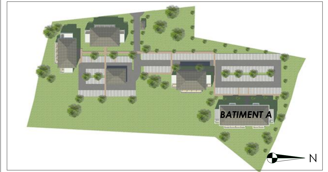
LOCALISATION PLAN MASSE