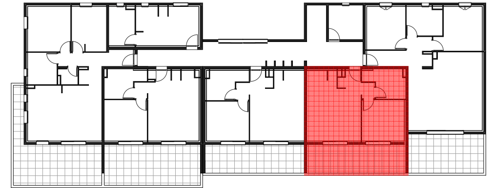
Plan d'étage courant R+2